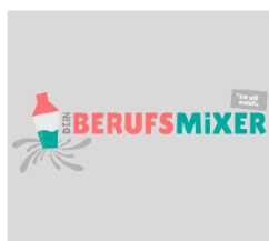
BERUFSMIXER LOGO (PRINT)