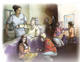
Wahrnehmen – Deuten – Handeln Rechtsextremismus in der Sozialen Arbeit keinen Raum bieten

DEUTSCHER PARITÄTISCHER WERKSTÄTTENVERBAND GESAMTVERBAND e. V. | www.paritaet.org